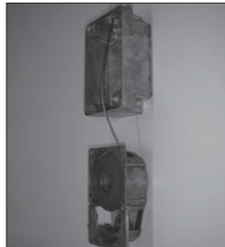
Plaats de spoel terug in de houder.