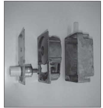
Haal nu het windwerk uit elkaar.