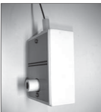
Schroef het afdekkapje vast.