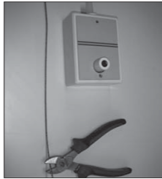
Knip het staaldraad \pm 25 cm voorbij het windwerk af.