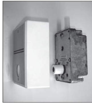
Haal het afdekkapje van het windwerk en schroef de achterliggende schroeven los.