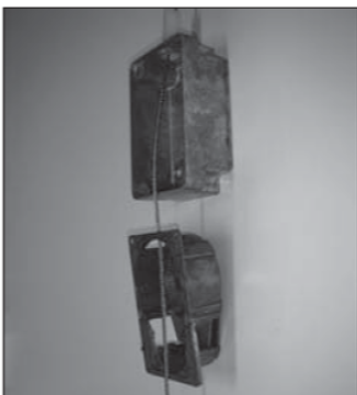
Voer het staaldraad door de muurplaat en spoelhouder.