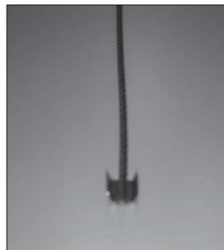
Klem om het uiteinde van het staaldraad de afdekklem.