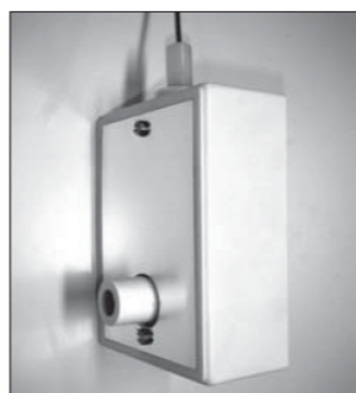
Verwijder nu de beschermingsfolie.