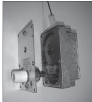
Plaats de spoelhouder in de muurplaat en dek deze met de deksel af.