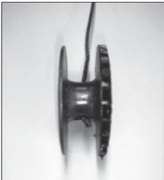
Trek nu het staaldraad terug in de spoel.