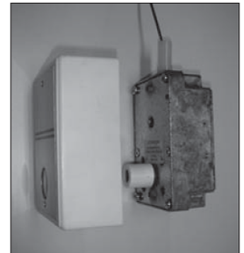
Schroef de deksel vast en dek deze af met het afdekkapje.