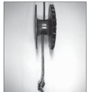
Maak nu een knoop in het staaldraad.